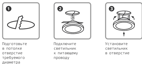
Рис. 1. Порядок монтажа

Монтаж продукции Gauss® должен быть произведен так, чтобы обеспечить надежную фиксацию и удобный доступ для обслуживания (рис. 1). Подключение светодиодных светильников к сети электропитания потребителя производится с помощью клеммной колодки согласно схеме (рис. 2).