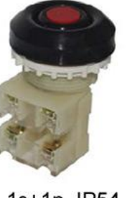
1з+1р, IP54 красный