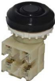
1з+1р, IP54 черный