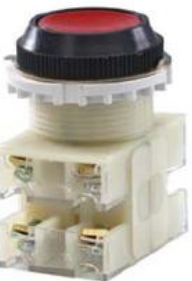
2з+2р, IP40 красный