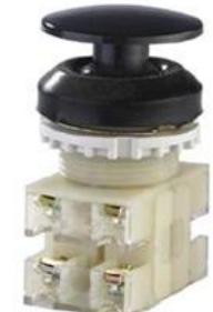
2з+2р, IP54, гриб, черный