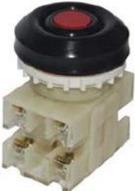
2з+2р, IP54 красный