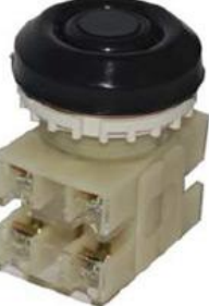
2з+2р, IP54 черный